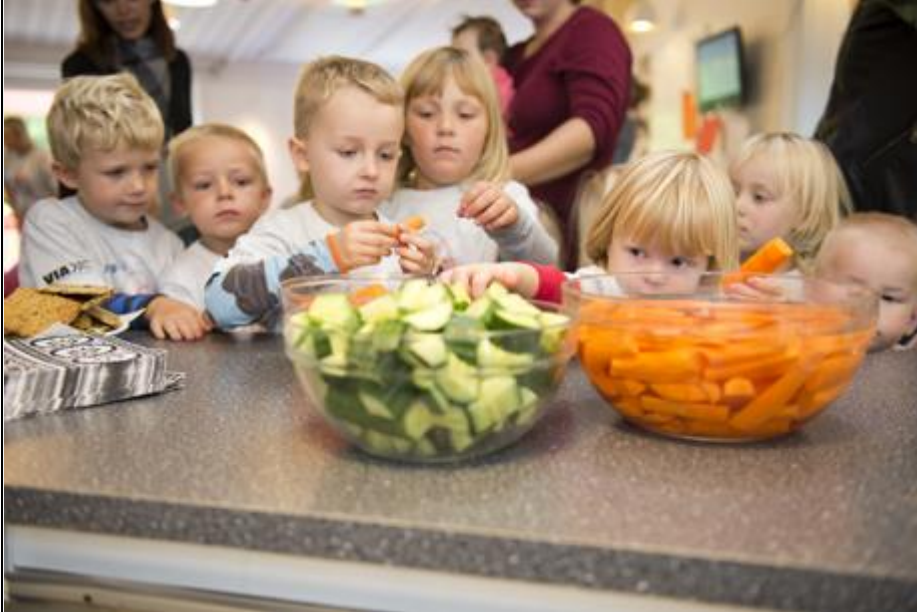
Børnene fik sunde snacks.

Efter talerne var der sunde snacks, og så blev der dystet i tovtrækning og afprøvet balancebane.