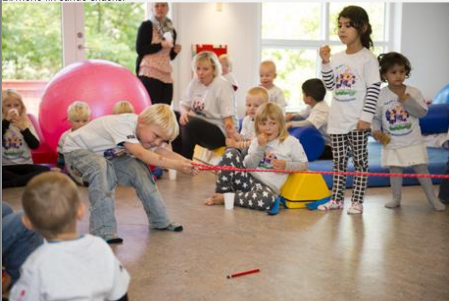
Efter overrækkelsen i Fjordtoppen blev der dystet i tovtrækning.

Læs mere om det samlede bevægelsesprojekt.