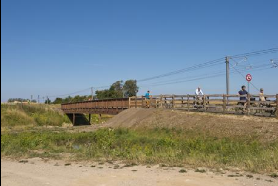
Den nye cykelbro.

Den nye bro krydser Snostrupvej ved S-banen, hvor arrangementet fandt sted. Det er nu muligt at cykle mellem Frederikssund Station og Ølstykke Station uden at skulle cykle ned på Snostrupvej.