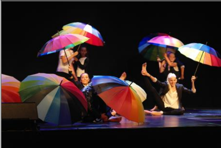
Værtskommunen, Ishøj, deltog også selv i Danseballen med dette farverige nummer.