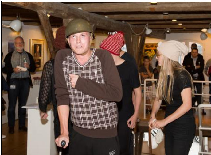
Ungdomsgruppen fra JAS underholder.