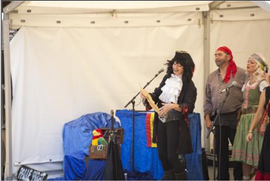
Palle Pirat i gang med sit show på Kalvøen.

Der var fyldt godt op på tilskuerpladserne med omkring 1.000 glade børn og voksne da Palle Pirat torsdag eftermiddag skød Frederikssund Festivalen i gang på Kalvøens friluftscene.