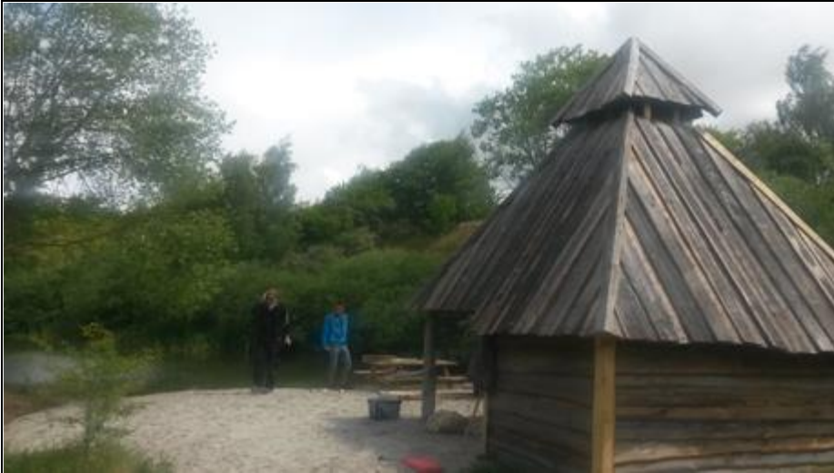
Bålhytten fra Skovbørnehaven i Skibby har fået nyt liv i Ådalen i hjertet af Frederikssund. I smukke omgivelser

Bålhytten ligger smukt ved en af de mange små søer, og passer sig fint ind i naturen, lidt gemt væk fra de mest befærdede stier, så der kan blive de bedste rammer for naturoplevelser tæt på flora og fauna.