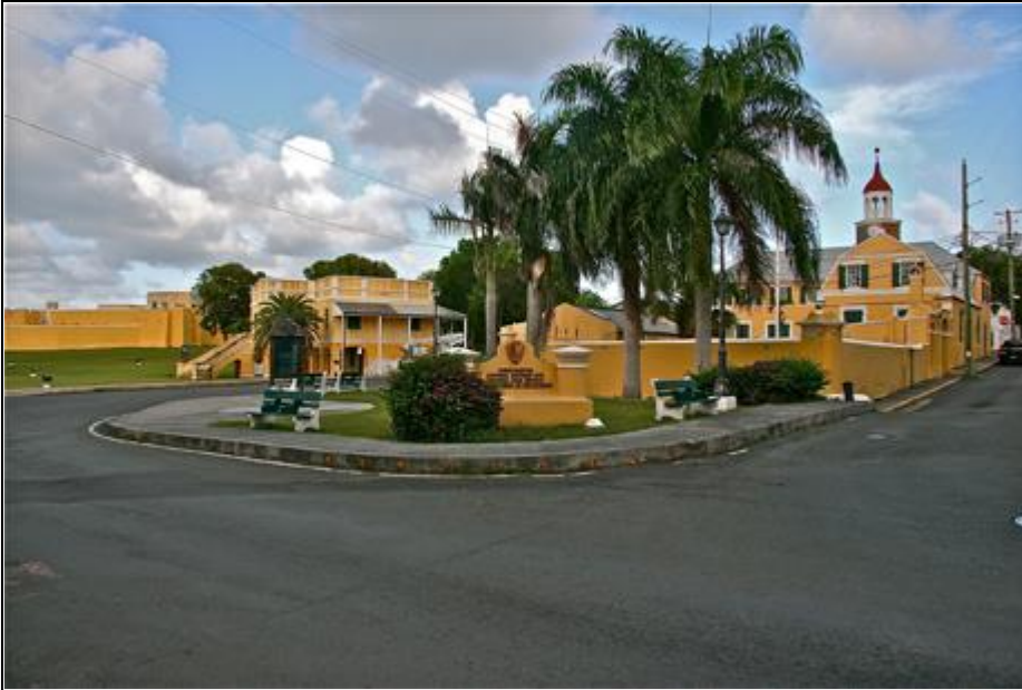
Toldbod, fort og slavestation på St Croix.