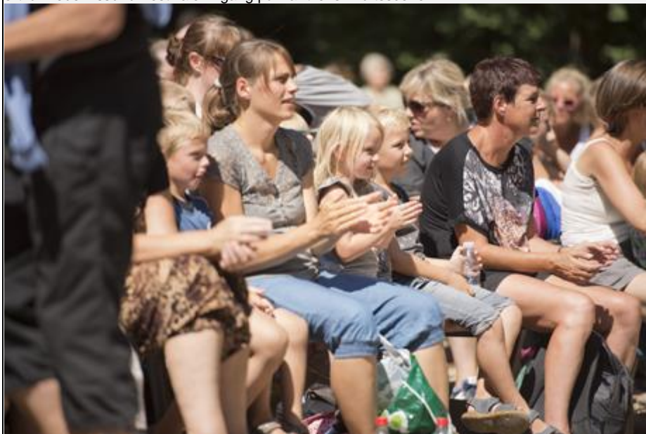
Der var godt fyldt op på bænke på Kalvøens friluftscene torsdag eftermiddag, og børn og voksne sang og klappede med til musikken.

Der var fyldt godt op på tilskuerpladserne med omkring 1.000 glade børn og voksne da Palle Pirat torsdag eftermiddag skød Frederikssund Festivalen i gang på Kalvøens friluftscene.