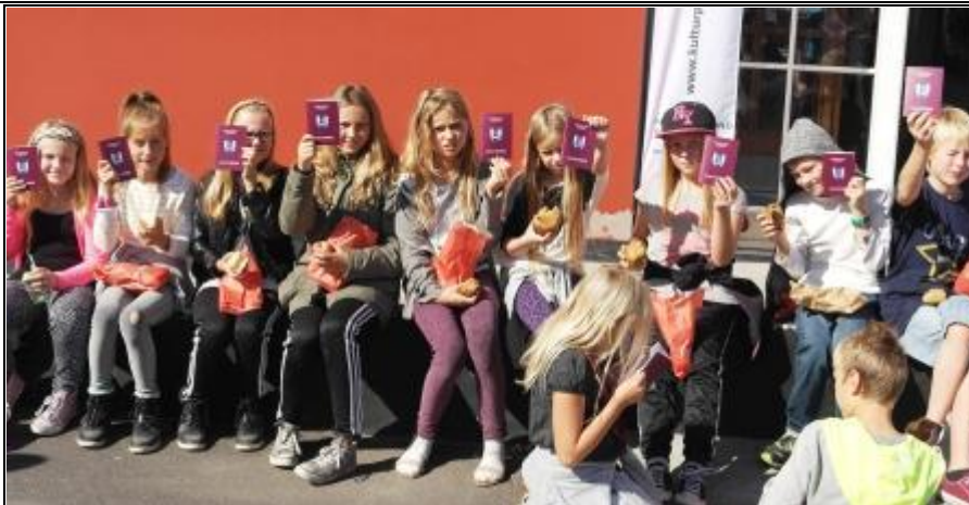
Kulturpasserne viser deres nye pas frem.