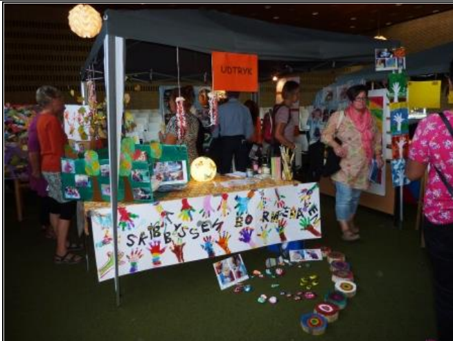
Billeder og tekst: Kirstine Balslev