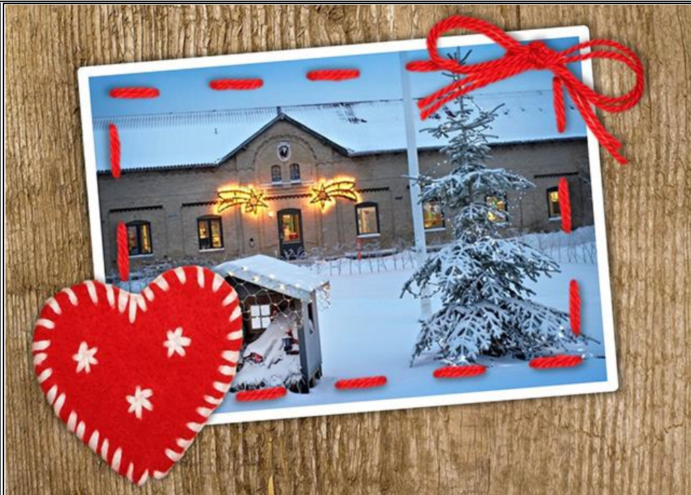
Vinterbillede af en af længerne på Højagergaard, indhyllet i sne.