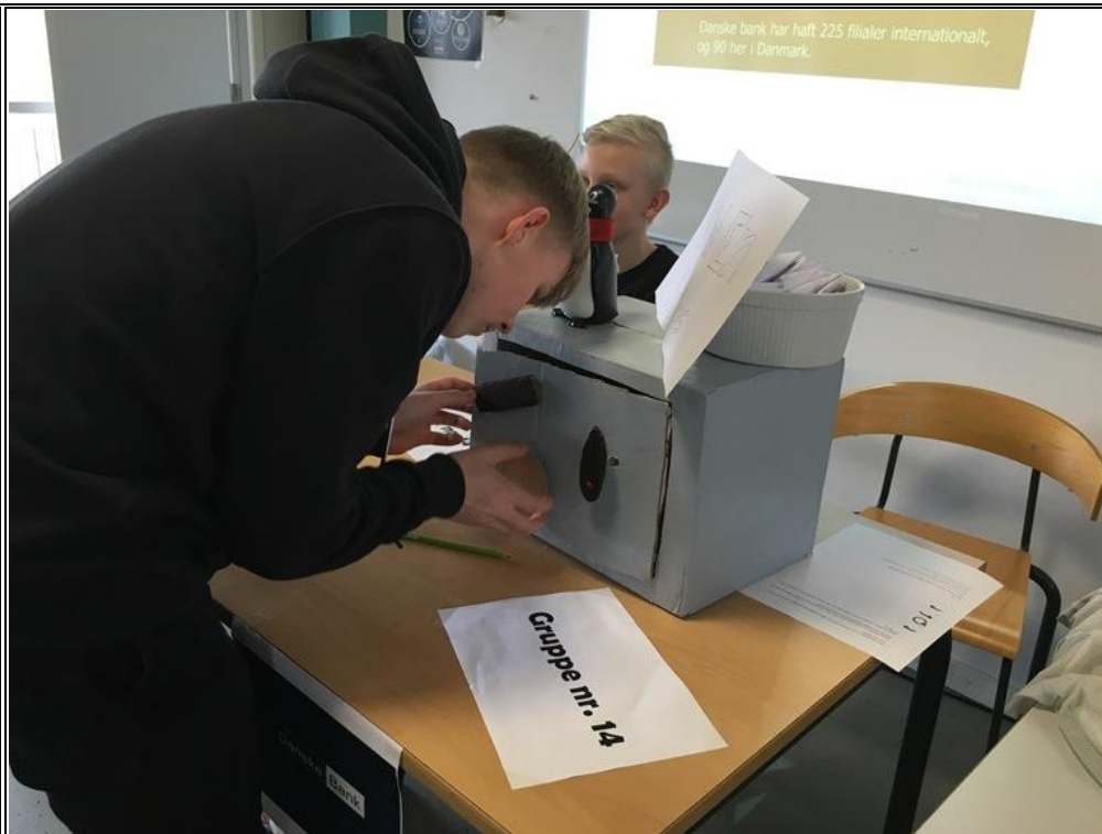
En af de grupper, der har været på besøg hos Danske Bank, har lavet en lille bankboks med kode.