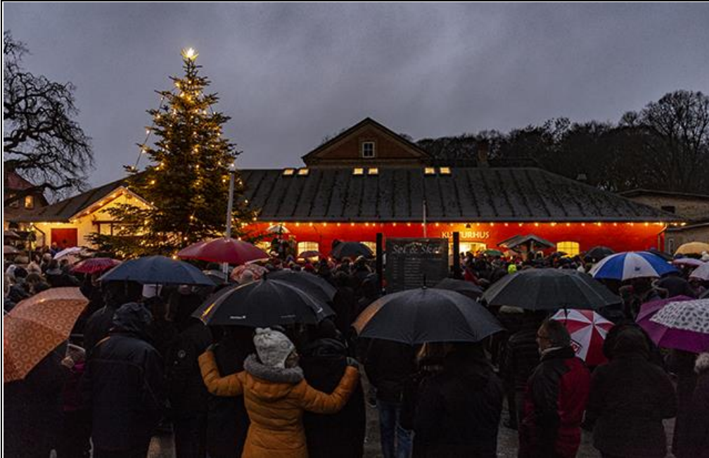
Juletræstændingen i Jægerspris skete i 2018 i regnvejr. Det afskrækkede ikke folk, men forhåbentlig bliver vejret bedre i år.