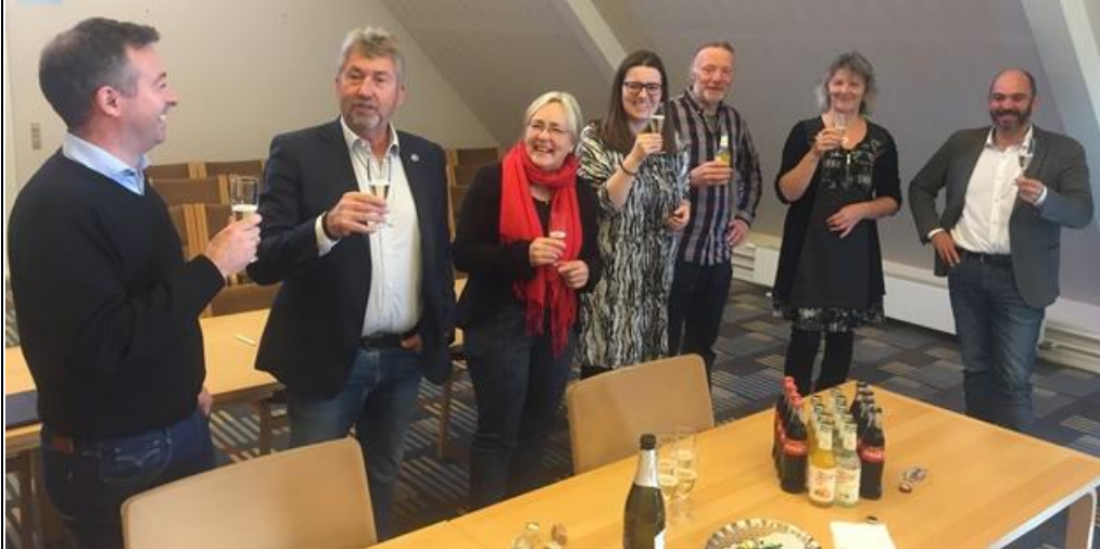
Der var plads til store smil og en fælles skål, da gruppeformændene og borgmesteren underskrev aftalen om budget 2020.

Frederikssund Kommunes budget bliver endeligt vedtaget ved Byrådets andenbehandling den 5. november 2019.