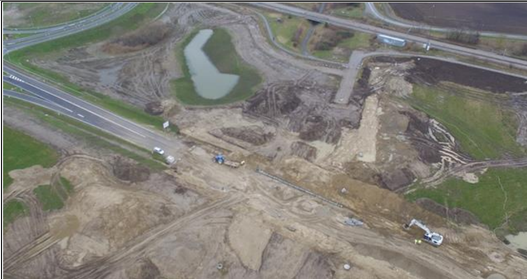
Området afvandes til det nye regnvandsbassin (øverst til venstre i billedet), som Vejdirektoratet har etableret lige øst for Frederikssundsvej ved det nye S-anlæg, der er en del af Fjordforbindelsen.