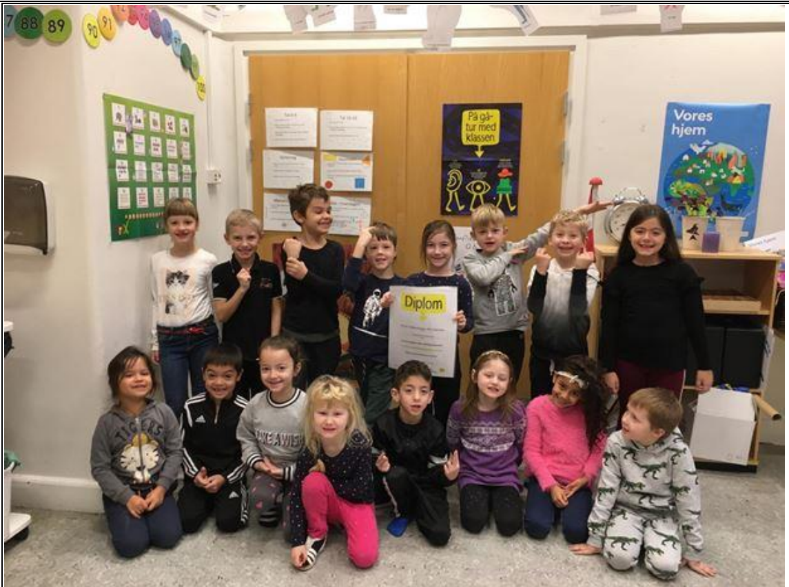
En flok glade børn i 0. B på Trekløverskolen afdeling Falkenberg viser stolt deres vinderdiplom frem efter at de var blevet udtrykket som vindere i trafikkonkurrencen.