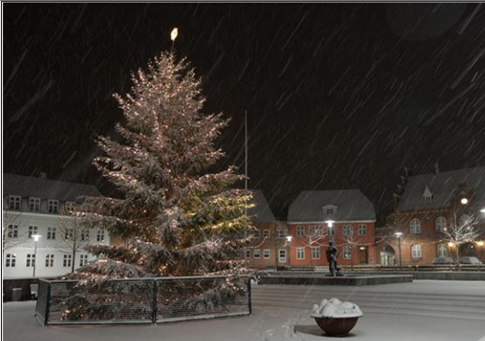
Juletræ i sne og aftenmørke på Torvet i Frederikssund.