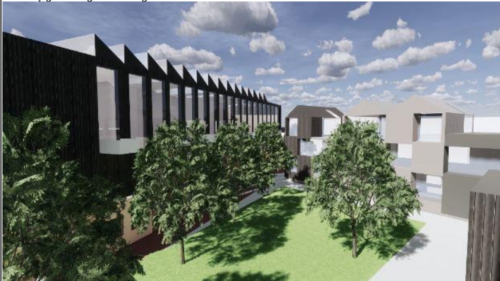
Den indre gård.

Den historiske arkitektoniske fortælling der ligger i bevarelse af den skrå bygnings industrielle facade styrkes ved at bygge ovenpå med 2.5 etager moderne atelierboliger. Vinduespartierne er store og giver specielt lys og udkig, taget er lavet med ovenlyskonstruktion og solfangere. I den sydvestlige del af denne overbygning placeres i 1. og 2. sal et fælleshus med festlokale, køkken og toiletter for beboerne. Hertil vil ligeledes være knyttet 3-4 værelser med bad til besøgende gæster. De øvrige bygninger er opdelt med et varierende udbud af lejligheder, herunder ungdomslejligheder, seniorlejligheder og familieboliger.