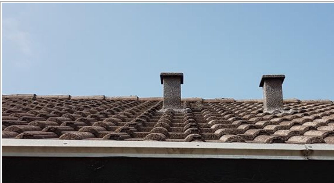
Faldstammeudluftning på et hustag.