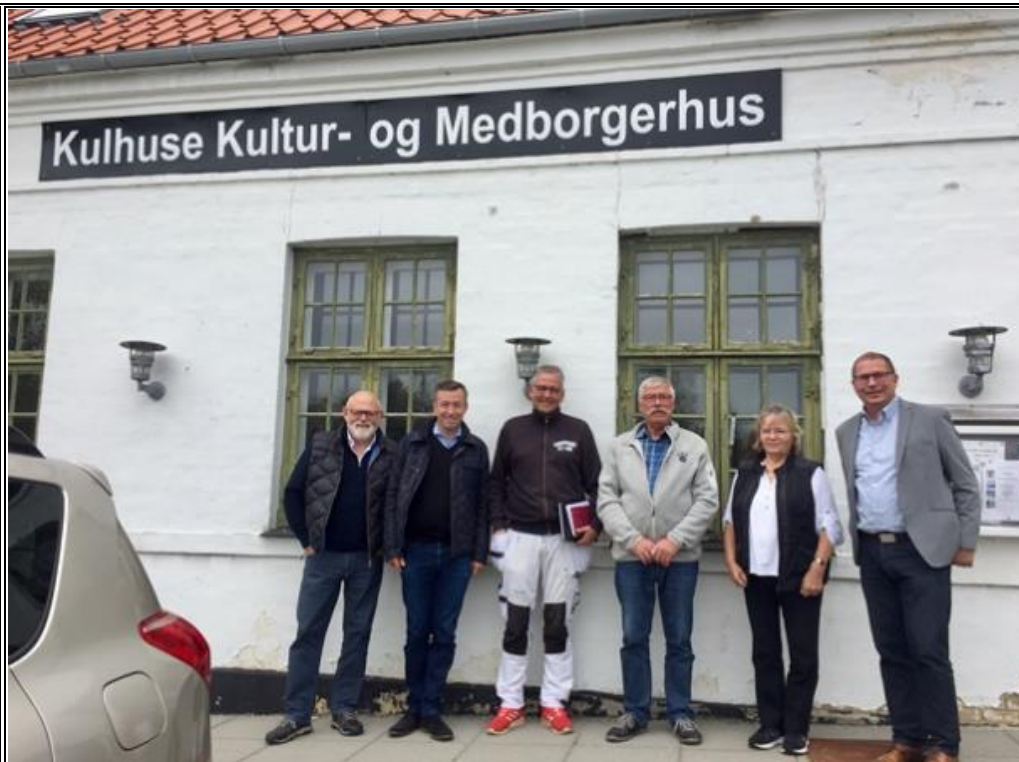
Udvalget for By og Land på besøg hos Kulhuse Kultur- og Medborgerhus.