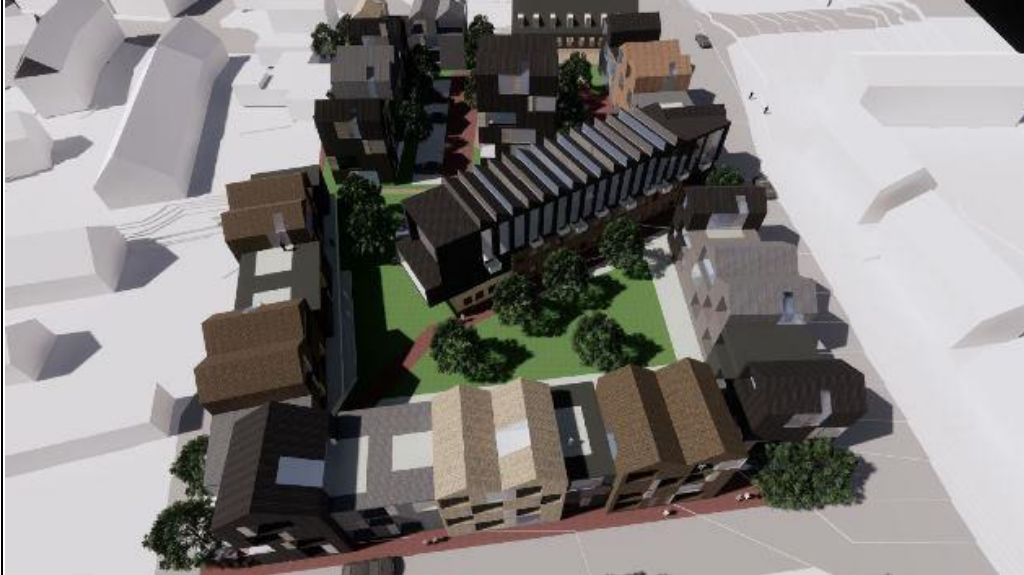
Overblik over det kommende byggeri på Fiomagruppen.