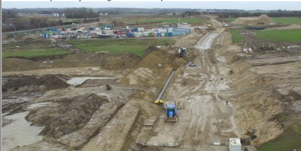
I den ene side af vejen lægges dræn, der skal føre regnvandet til bassinet i nærheden.