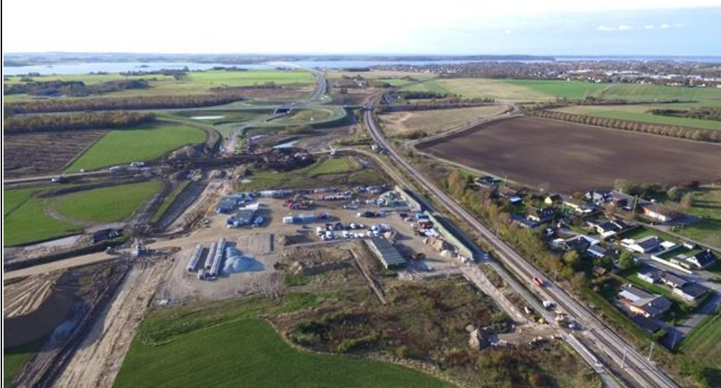
Udsigt over Banedanmark og Aarselff Rails byggeplads. I venstre side af billedet arbejdes der med anlæg af Vinge Boulevard og i baggrunden skimtes Kronprinsesse Marys Bro.