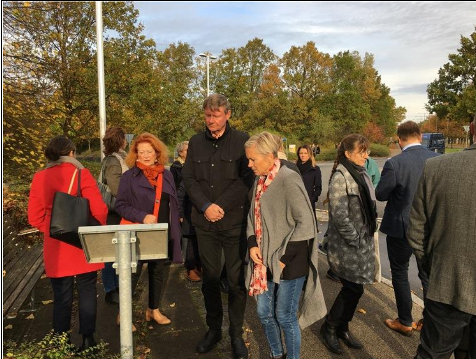
Flere af deltagerne i venskabsbytræffet var herne og læse det skilt, der står ved Nordens Rundkørsel, hvor man kan læse om de fire sten, der står midt i rundkørslen. Stenen repræsenterer de fire byer.