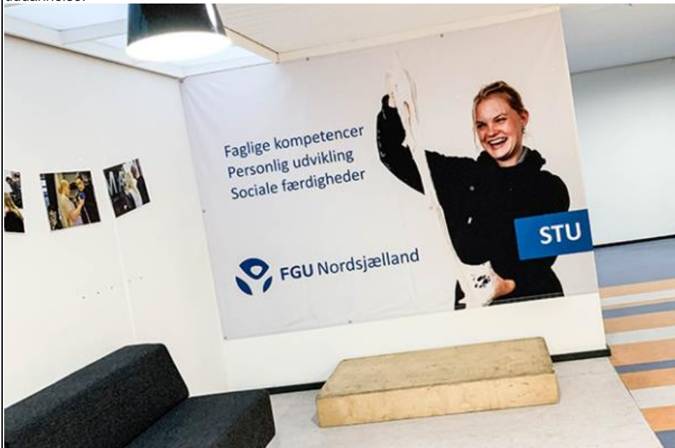
Reklame med skolens formål: Faglige kompetencer, personlig udvikling og sociale færdigheder.

FGU afløser og kombinerer det bedste fra produktionsskolerne, den almene voksenuddannelse (AVU) og Forberedende Voksenuddannelse (FVU) på VUC, den kombinerede ungdomsuddannelse og andre tilbud der har været for de unge som har svært ved at finde fodfæste i det ordinære uddannelsessystem, og derfor har brug for en lidt længere vej til uddannelse.