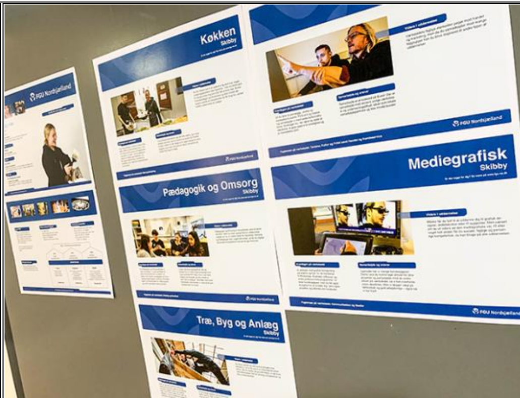
Udpluk af linjerne på FGU Frederikssund.