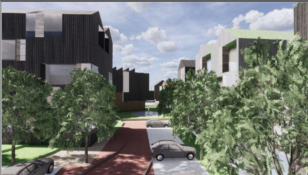
Der bliver mulighed for parkering mellem boligerne. Illustrationer: Schmidt/Hammer/Lassen/Architects.