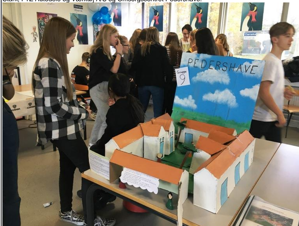
En af grupperne, der havde besøgt Omsorgscentret Pedershave, havde bygget omsorgscentret og skrevet en masse fakta på sedler.

Ti virksomheder har i år deltaget. Fjordlandsskolens elever har besøgt Koatek A/S, Brdr. Ewers A/S, Omsorgscentret Nordhøj og XL-BYG Bjergmark A/S. Trekløverskolen elever har besøgt Danske Bank, Sillebroen Shopping, Scania, Stark, FTZ Autodele og Værktøj A/S og Omsorgscentret Pedershave.