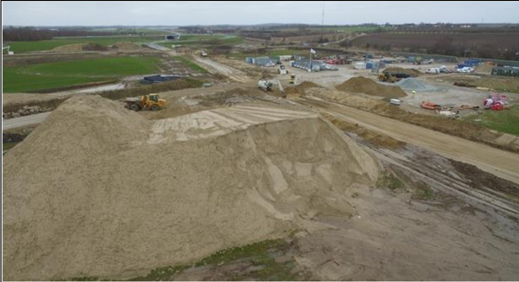
Efter Vejdirektoratets byggeplads for enden af Marbækvej lukkede er gruset fra pladsen nu flyttet op i et "bjerg" på marken ved Vinge, hvor det bruges som vejfyld.