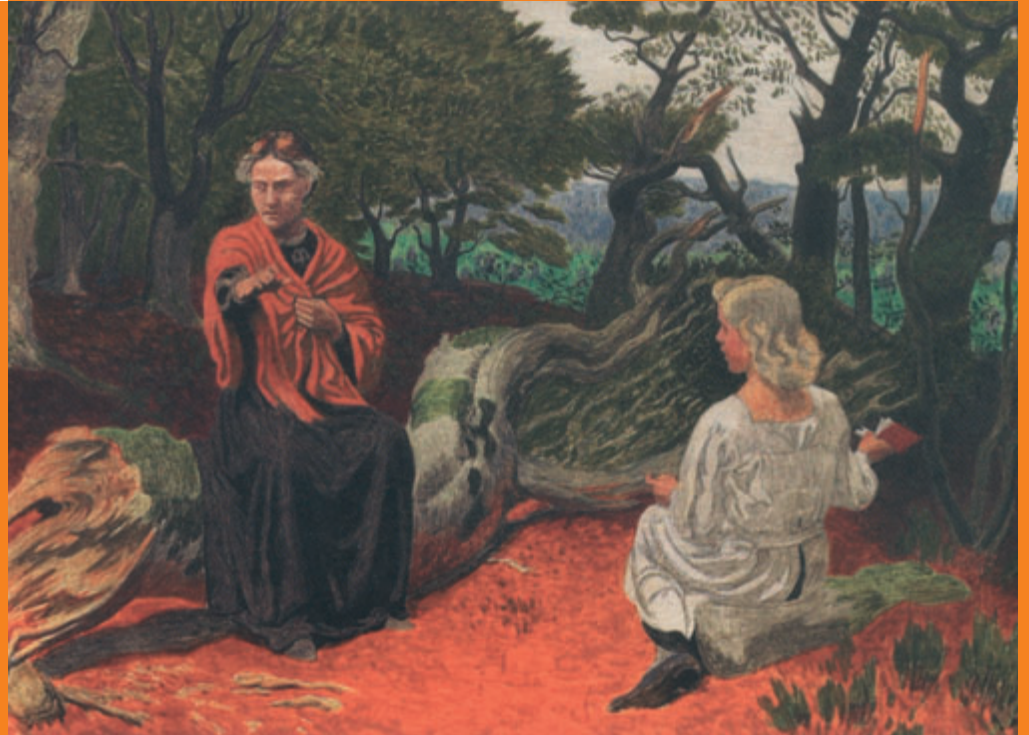
J.F. Willumsen. To kvinder i en skov. 1908

ligeholdelsesarbejde, men det forventes, at der i 2004 foretages større isoleringsarbejder for at minimere energiomkostningerne i forbindelse med drift af bygningskomplekset.