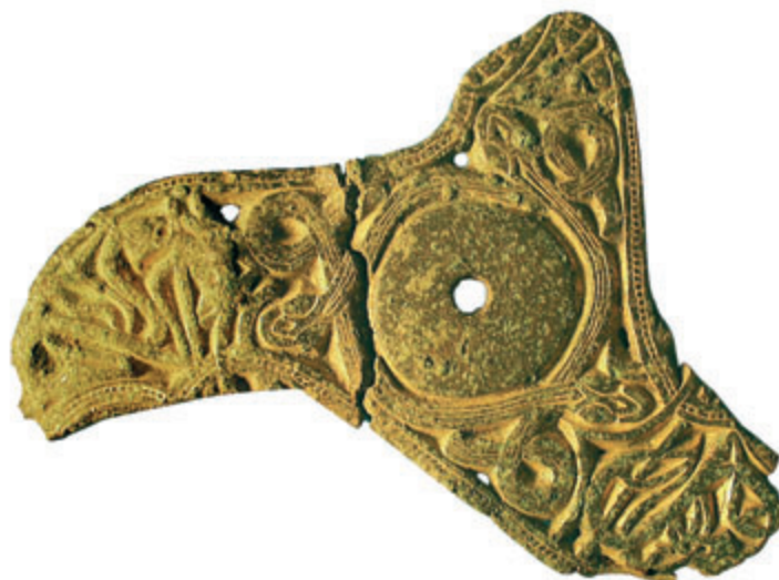
Trefliget smykke fra tidlig vikingetid, fundet ved Græsegård

Byrådet afsætter efter indstilling fra Folkeoplysningsudvalget de økonomiske rammer til lokaletilskud, klubber og foreninger. I alt var der afsat 5.080.360 kr. til folkeoplysende formål i 2003.