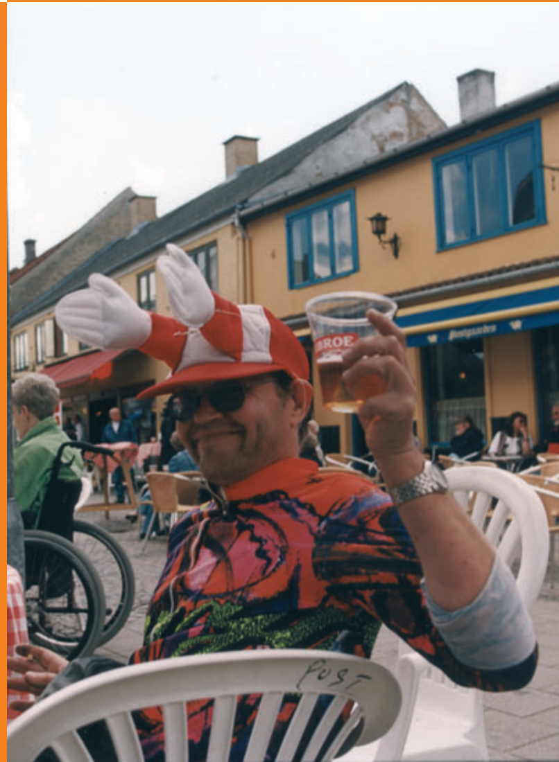
Sommerstemning i Gågaden

Elevtallet fordeler sig pr. 12. januar 2004 med 231 elever til instrumentalundervisning/solosang, 28 elever til korsang, 62 elever til sammenspil, 27 elever til teori, 55 elever på forældre/barn hold, og 17 elever på hold for 0.-2. klasse. Hertil kommer 6 børnehaver, som får eller har fået musikundervisning i