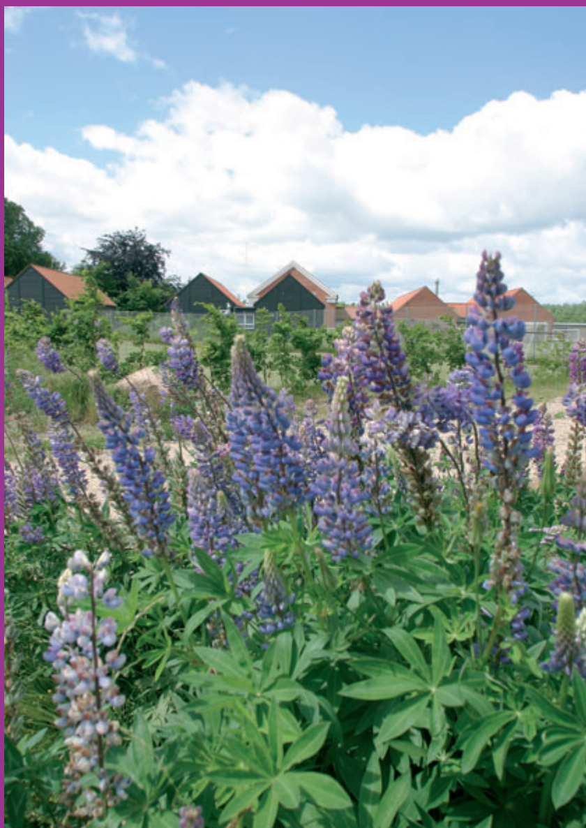
Lupiner ved Gyldenstenskolen

re, som kommer til Frederikssund i dag? Og hvad får dem til at vælge Frederikssund? For at få svar på de spørgsmål har Byrådet gennemført en spørgeskemaundersøgelse blandt de seneste 2 års til- og fraflyttere. Nogle af de mest interessante resultater af undersøgelsen er, at tilflytterne kan deles op i to grupper med meget for-