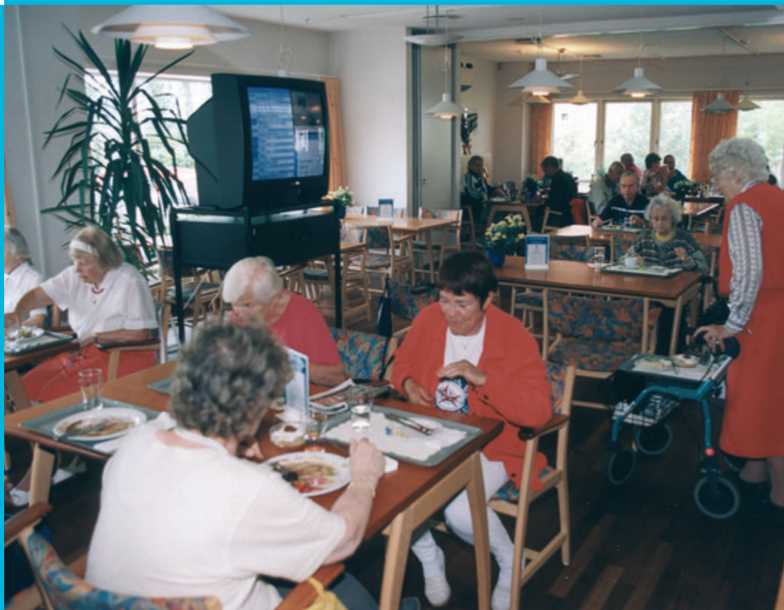
Eftermiddagshygge på Lundebjerggård

Af de anbragte unge kan 11 rummes i ungdomsboligerne,