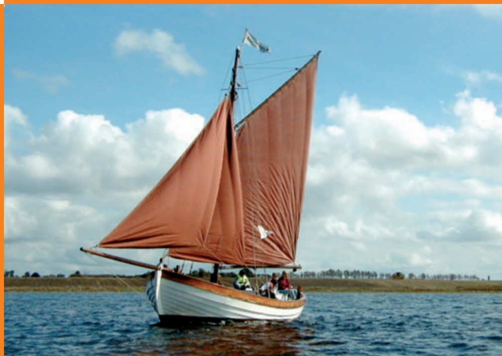
Museums- skibet "Sommerflid"

"Gamle Samling" sendt til ind- og udland.