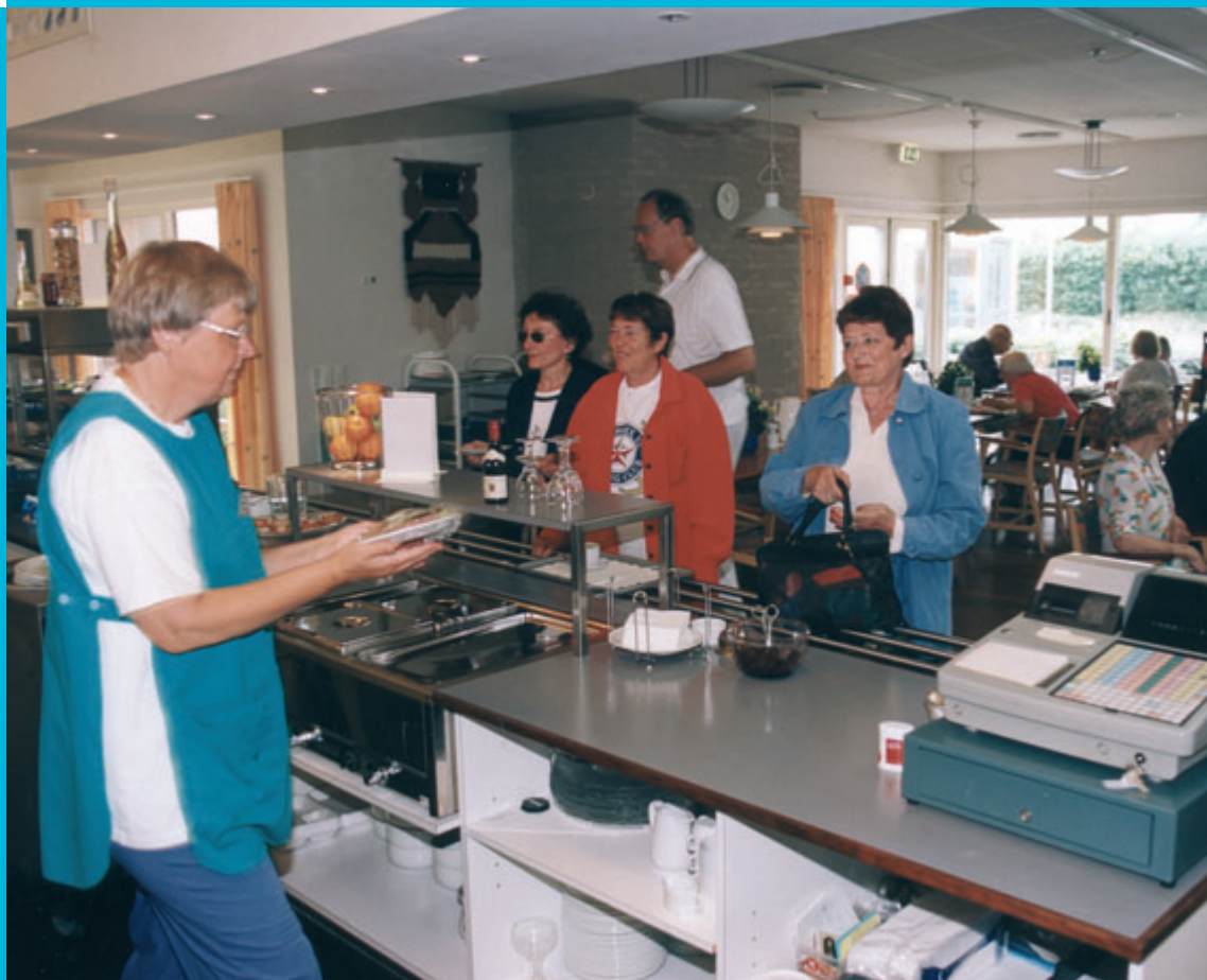
Kantinen på Lundebjerggård

Der skal ydes en tidlig og koordineret indsats for at forebygge udvikling af sociale, følelsesmæssige eller helbreds-mæssige problemer hos børn og unge og fremme deres trivsel og sundhed.