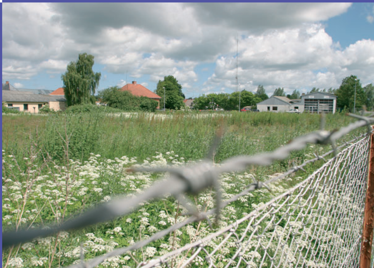
Friareal ved A.C. Hansensvej

Baggrunden for at Frederikssund Kommune er gået med i projektet er, at den kommunale vand- og spildevandsforsyning ønsker at være med i