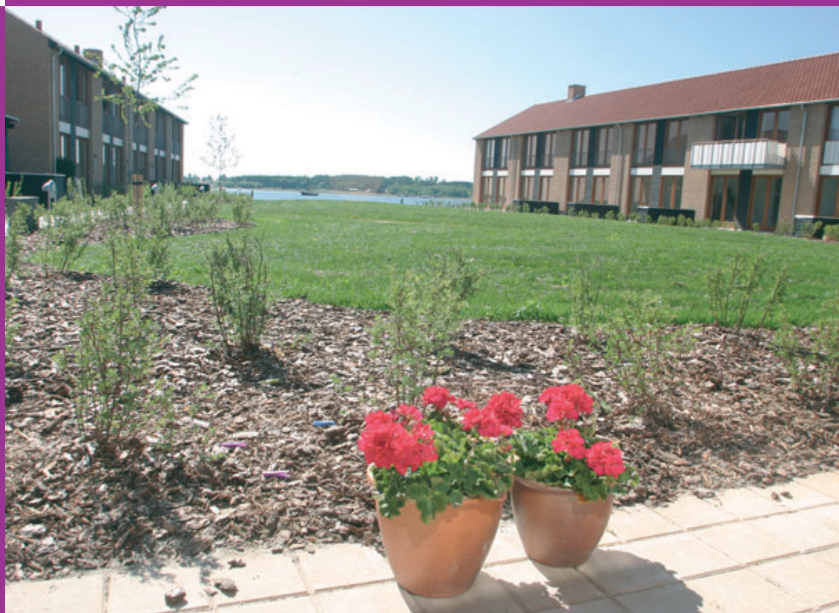
Nybyggeri ved Nordre Pakhusvej

Udgangspunktet for arbejdet er de omkostningsberegninger som allerede er foretaget