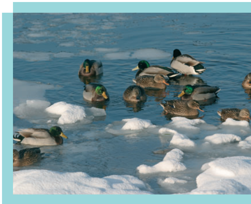
Vinterstemning i fjorden

I aftalen indgik, at den gennemsnitlige udskrivningsprocent, den gennemsnitlige grundskyldspromille og dækningsafgifterne for erhvervejendomme ikke måtte stige for kommunerne under ét i forhold til niveauet i 2002. Regeringen havde tilkendegivet, at den ville