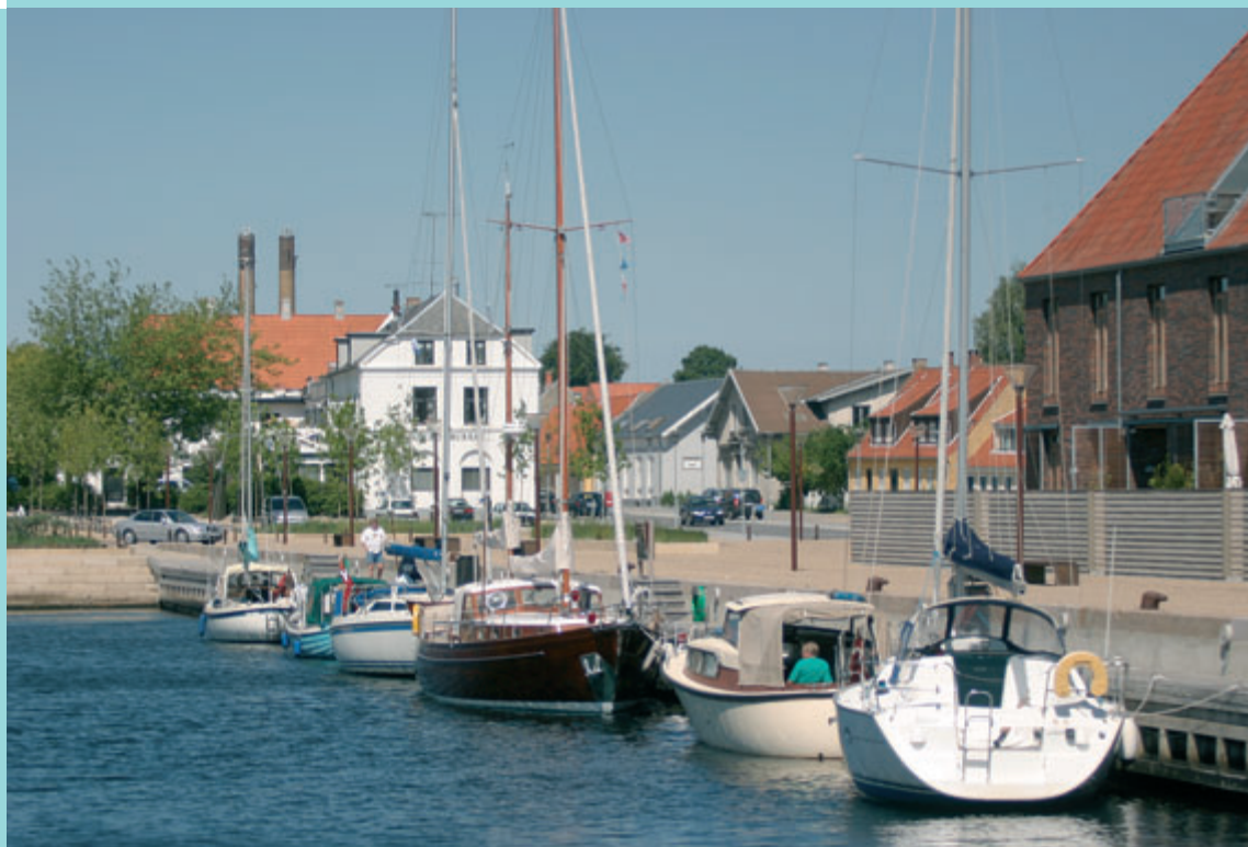
Skibe ved Østkajen

Aftalen indeholdt et særskilt afsnit om folkeskoleområdet "Forståelse på folkeskoleområdet mellem KL og Regeringen". Indholdet af en aftale på folkeskoleområdet havde været til diskussion i folketinget i løbet af sommeren og efteråret 2002, og ved vedtagelsen af budget 2003 var der endnu ikke indgået forlig.