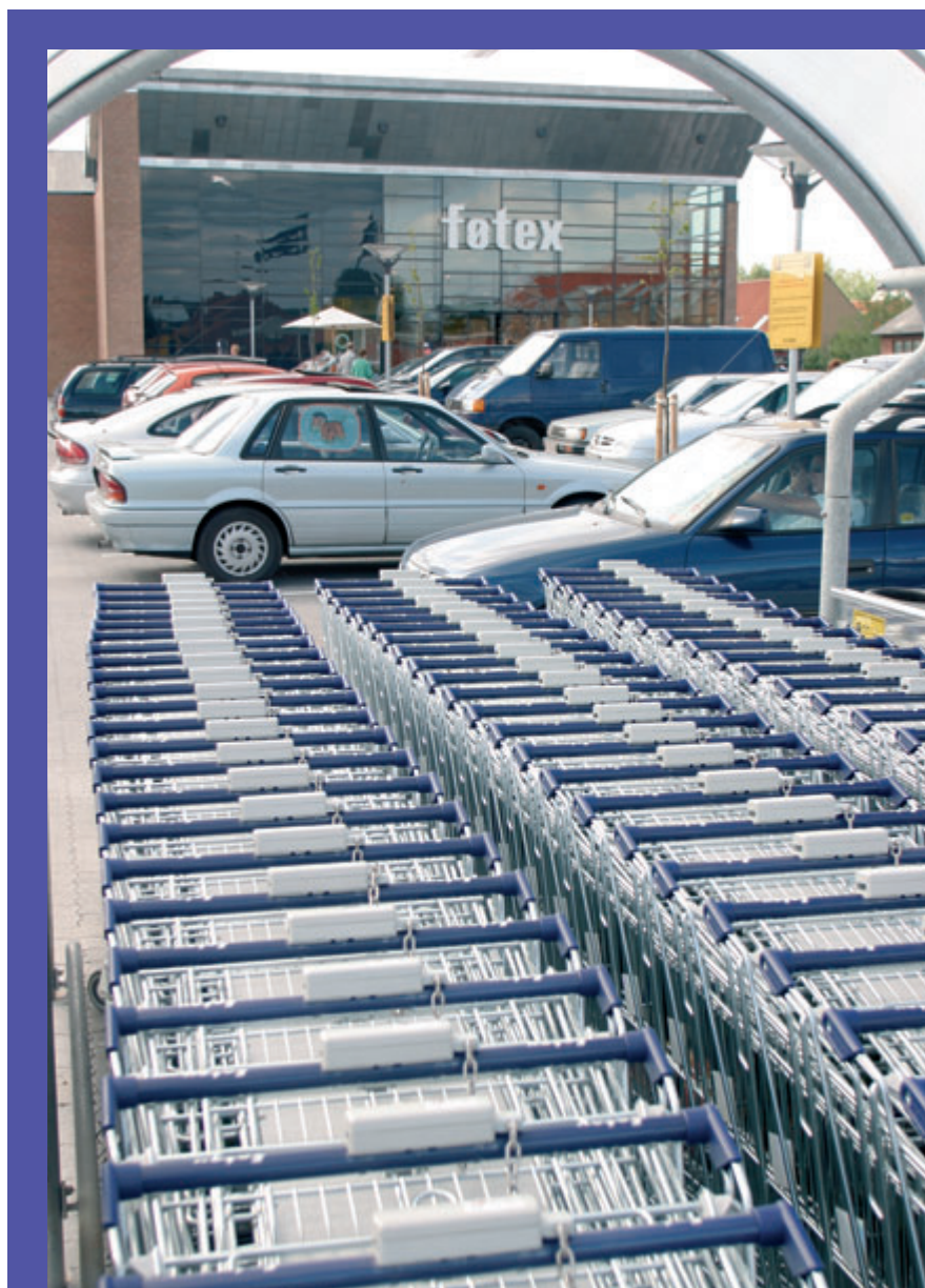
Det nye Føtex åbnede den 29. april 2004

De første ca. 160 lbm. af Kanalen fra havnebassinets