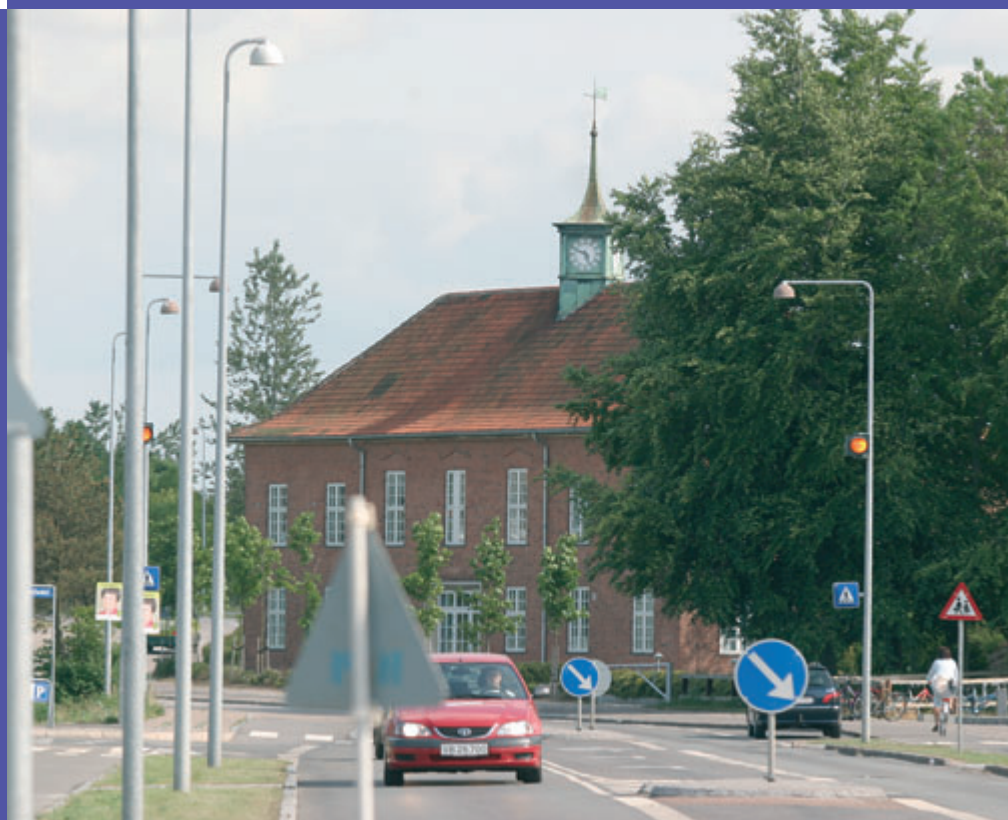
A.C. Hansensvej. Den gamle stationsbygning

Trafikalt tages der hensyn til de bløde trafikanter i form af fartdæmpende foranstaltninger såsom hævede overkørsler, indsnævring m.v. med hastighedsbegrænsning på 40 km/t i det ny boligområde. Endvidere bliver Sigerslev-vestervejs vestlige tilslutning til Frederikssundsvej lukket for at fjerne et farligt vejkryds samt for at hindre unødige tra-