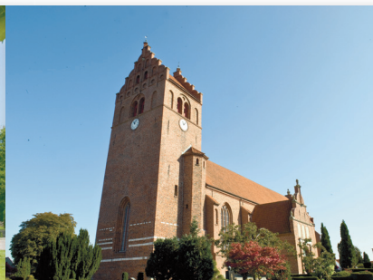
Sct. Michaels Kirke, Slangerup