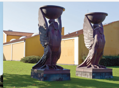
J.F. Willumsens Museum

Frederikssundegnen før og Frederikssund Kommune nu