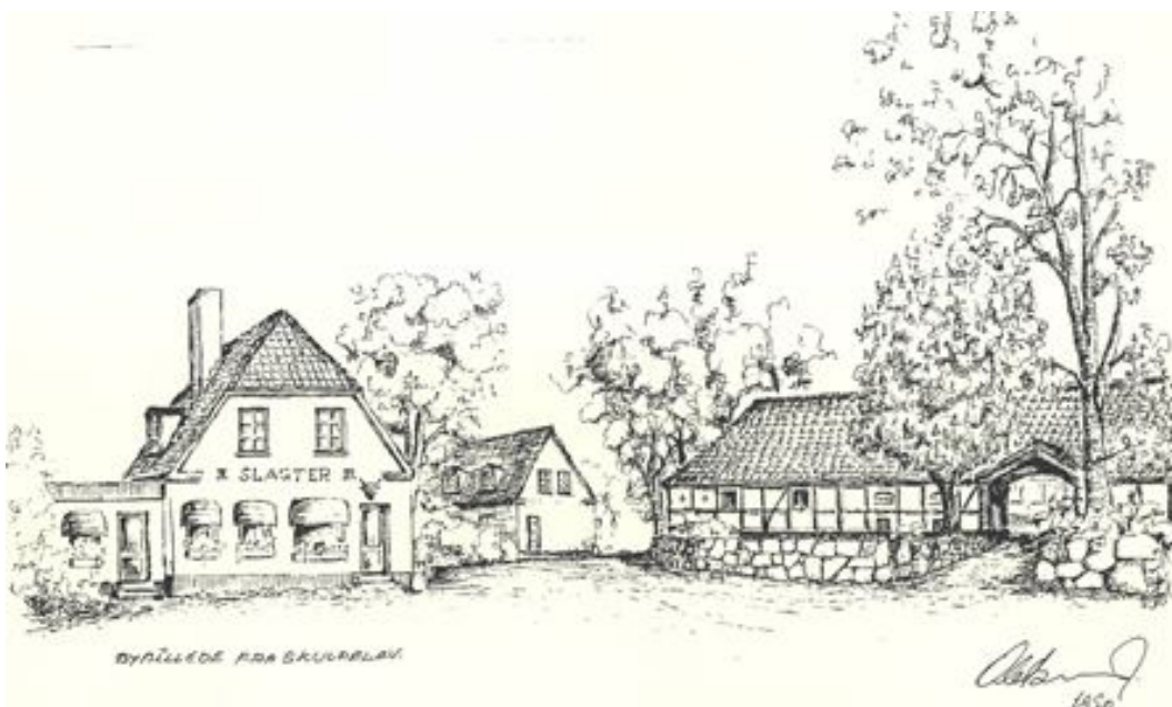
Bybillede fra Skuldelev med slagterbutikken (udateret). Tegnet af Ole Brandt, Skibby.