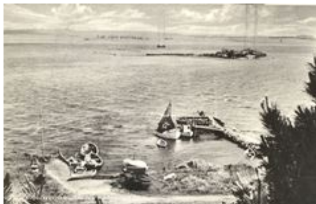
Skuldelev Strand med havn.

I skolen kom alle børn fra Skuldelev Sogn – 1. klasse: 1.-2. årgang, 2. klasse: 3.-4. årgang, 3. klasse: 5.-6. årgang og 4. klasse: 7. årgang – mesterligt ledet af førstelærer Ejner Hansen, som også var kirkesanger. Desuden underviste skiftende lærere og præsten.