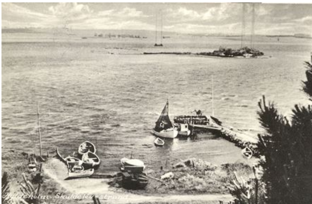
Skuldelev Strand med havn (udateret billede venligst udlånt af Harly Paaske, Skuldelev Dukkemuseum).