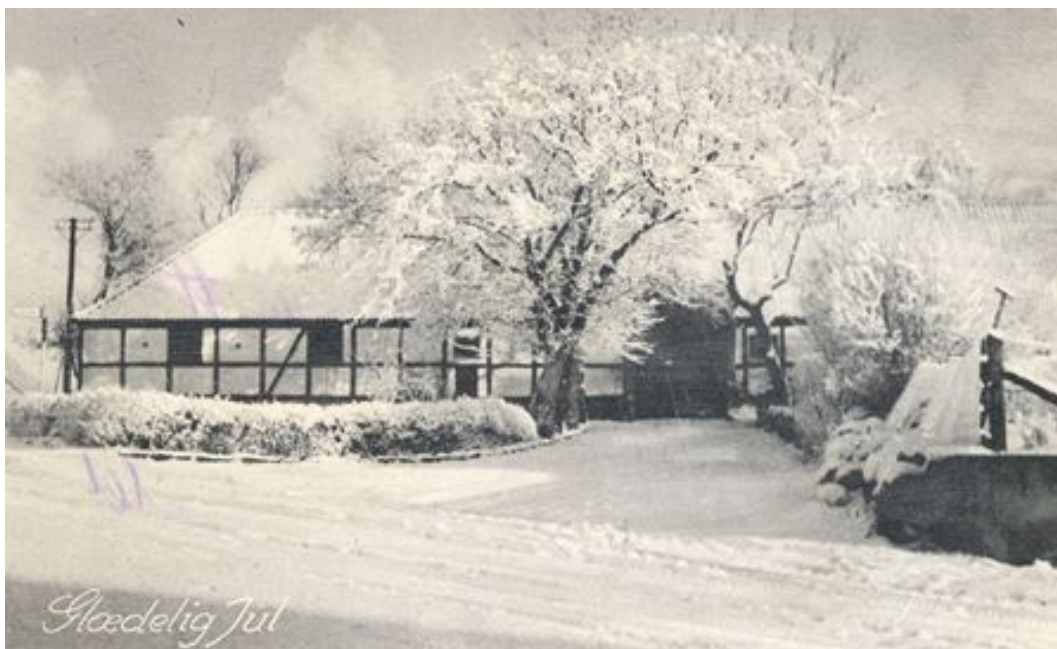
Skuldelev Præstegård (udateret).