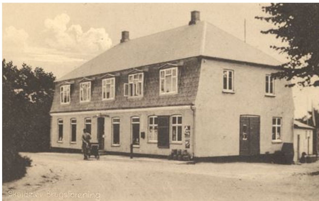
Skuldelev Brugsforening.