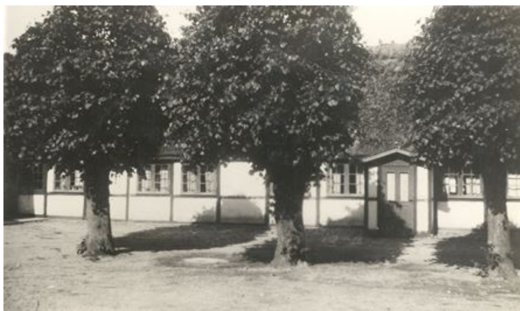
Skuldelev Kro (udateret).