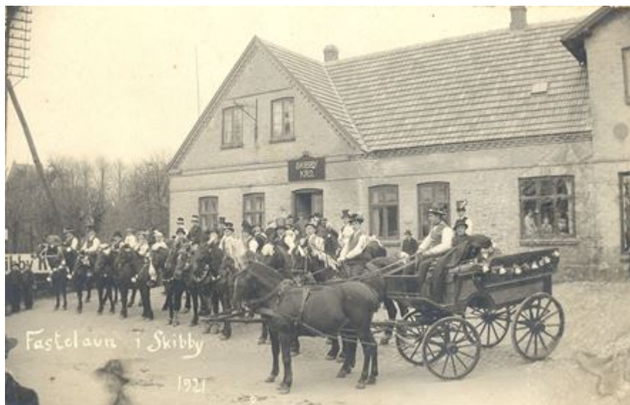
Fastelavn med heste foran Skibby kro, 1921.