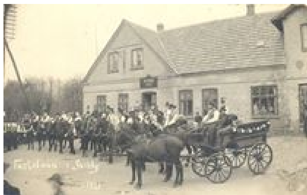
Fastelavn med heste foran Skibby kro, 1921.

Og kroen var jo samlingssted med mange fester for private, foreninger og skoler. Sognerådsmøderne blev holdt på kroen, og større forsamlinger mødtes dér til diskussioner af aktuelle sager. Og så var der naturligvis ballerne. Nogle værelser til handelsreisende og andre, der havde brug for overnatning, var der også.