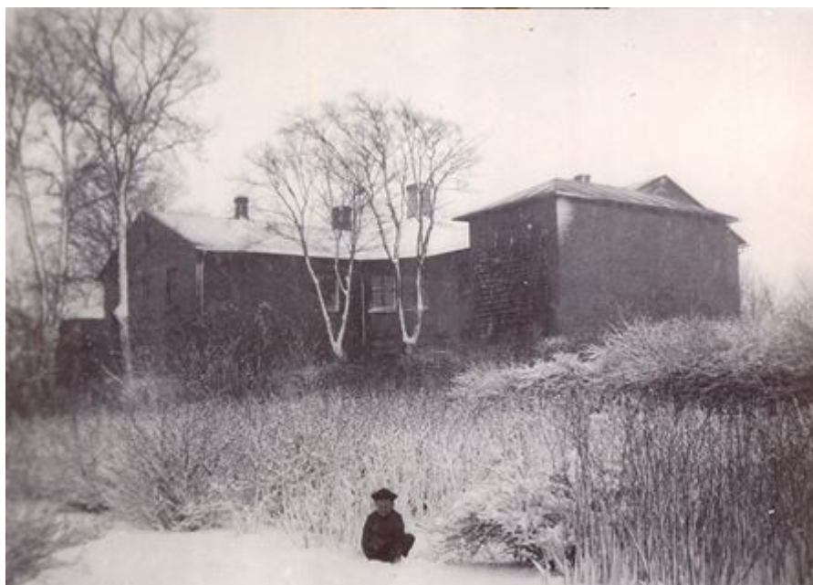
Hornsherreds Arbejdsanstalt, 1937, set fra urtehaven (nordsiden).