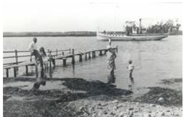
Badebroen ved Selsø Møllekrog 1921 eller 1922. I baggrunden ses sandsynligvis dampskibsfærgen Horns Herred 2.

Med sin centrale beliggenhed har Skibby været det naturlige centrum for vejforbindelser på halvøen. Linjeføringen i det gamle vejnet er i stor udstrækning bevaret i nutidens og viser, hvordan det naturligt stråler ud fra byen. Hvis vi rykker blot 100 år tilbage, var trafikken på dem meget begrænset. Dengang foregik megen samfærdsel med apostlenes