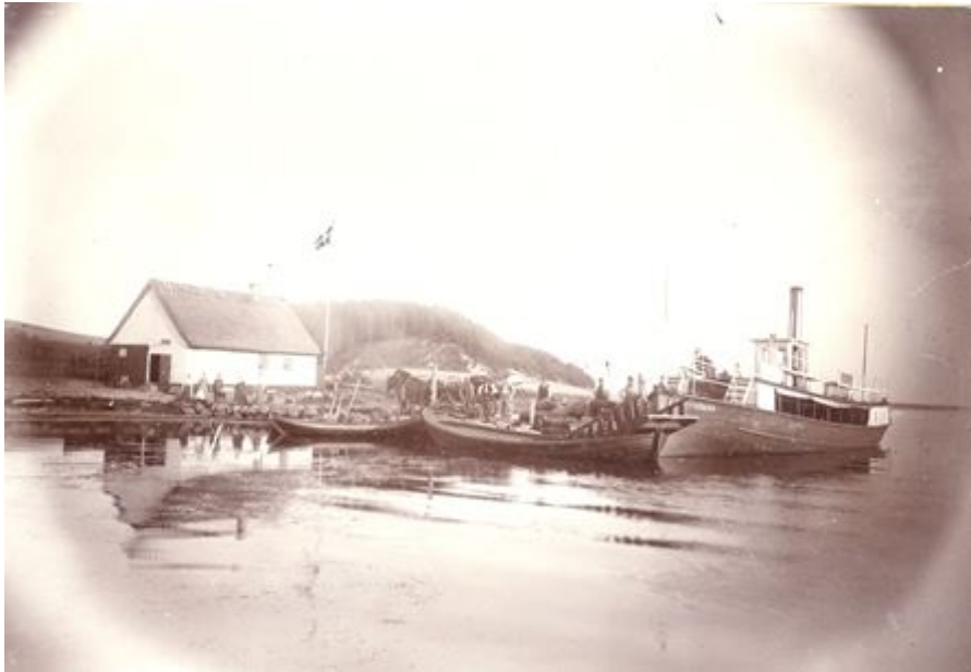
Selsø Møllekrog med sandsynligvis S/S (dampskibet) Horns Herred 1 som sejlede færgefart på Roskilde Fjord fra 1882 til 1913 hvor den blev afløst af Horns Herred 2.