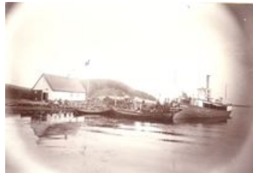
Selsø Møllekrog med sandsynligvis S/S (dampskibet) Horns Herred 1.

optog man i en periode sejladsen for at fragte blandt andet svin til slagteriet i Roskilde med skib fra Møllekrogen.