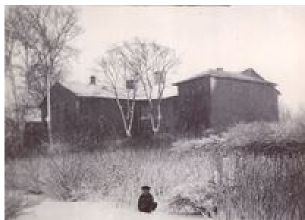
Hornsherreds Arbejdsanstalt, 1937, set fra urtehaven (nordsiden).

I byens nordlige udkant ligger en bemærkelsesværdig stor bygning, nemlig den gamle arbejds- og forsørgelsesanstalt fra 1869 med plads til 100 beboere. Det var ikke et sted, man ønskede sig hen, men ikke desto mindre var det et langt bedre og mere velordnet sted end de normale små fattighuse i landsbyerne, hvoraf der også lå et i Skibby. Det rummede et blandet klientel. Der var stærkt vanføre, blinde, evnesvage, sindssyge, fattige uden mulighed for at klare en husleje, enker med faderløse børn, fordrukne m.fl.